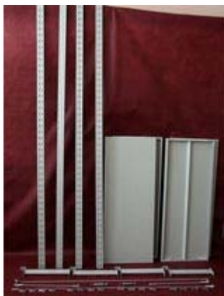
Схема сборки стеллажа серии СУ

В стандартную комплектацию стеллажа входят: 4 стойки, 4 полки, 16 клипс, 2 поперечины, 4 стяжки-подпятника, 1 крестовина жесткости.